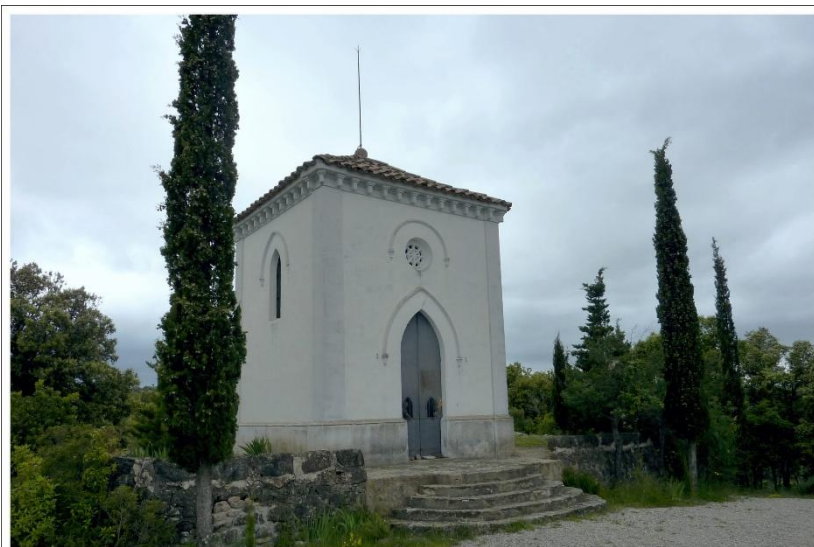
Capella del Sagrat Cor

religiosa que ha tingut al llarg del temps. Parlarem de com l'església servia com a centre espiritual i social per a les comunitats que habitaven la zona.