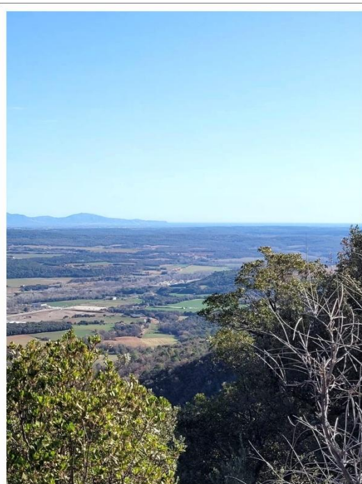
Mirador des del Sagrat Cor

Finalment, baixarem de nou fins al punt de sortida, tancant aquesta excursió que combina història, cultura i natura , i que ens permetrà conèixer més a fons Besalú i els seus voltants, tot caminant pel territori i gaudint dels seus racons plens de passat.