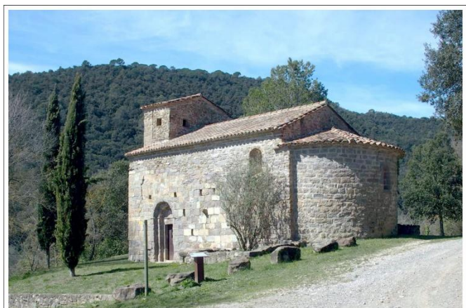
Església de Sant Fruitós d'Ossinyà

Continuarem la nostra ruta fent parada a la Font de l'Ametller , un indret històricament important per al poble i els seus voltants. Aquesta font, envoltada d'arbres i de vegetació típica de la zona, era un punt de trobada i