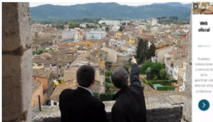
Panoràmica de Banyoles des del campanar del monestir de Sant Esteve, en una imatge d'arxiu.

El consistori preveu fer visites guiades a partir d'aquest 2025