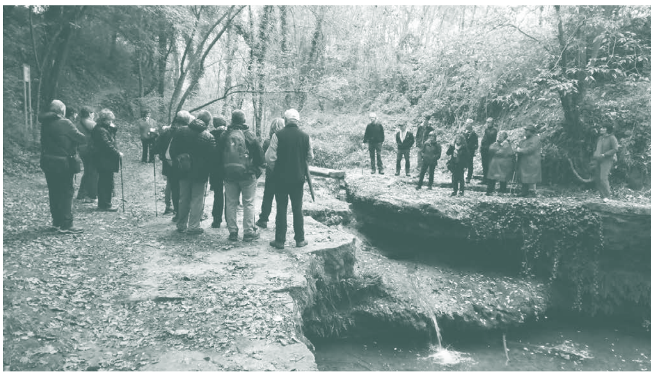
Grup a la gorga Blava.