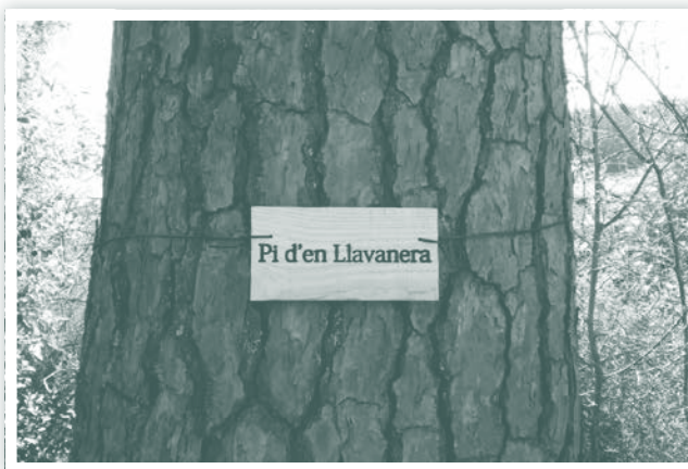
Rètol que es va col·locar en aquest arbre monumental.