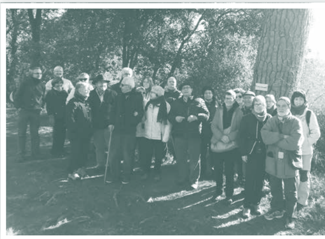
Grup davant el pi d'en Llawanera.