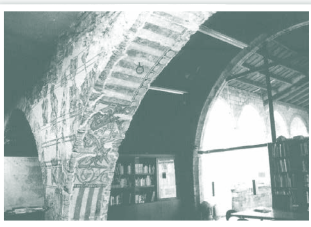
La sala Corominas acabada, l'any 1985.