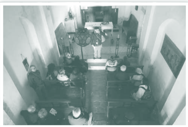
Ermita de Sant Just i Pastor, de Pedrinyà.