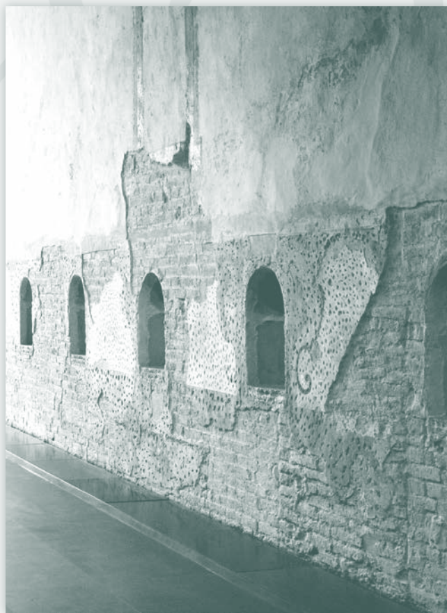
Antiga paret de l'Ospedale de Santa Maria della Scala de Siena (Anna Bahí)

Serà un viatge del qual us anirem informant i en què també aprofitarem per fer una incursió en un estil arquitectònic desconegut al nostre país: l'art etrusc.