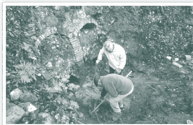
Netejant la boca d'entrada de l'antiga rajoleria de Ca l'Abella.

En resum, es tracta d'una de les millors rajoleries de les quatre que tenim a la nostra comarca, les de Can Barranc (Vilademi), Can Vila (Pujarnol) i Can Masdemont (Les Anglades).