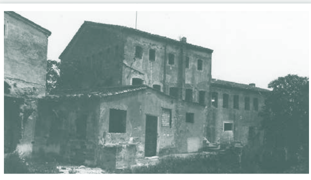
L'edifici de la Farga l'any 1984.