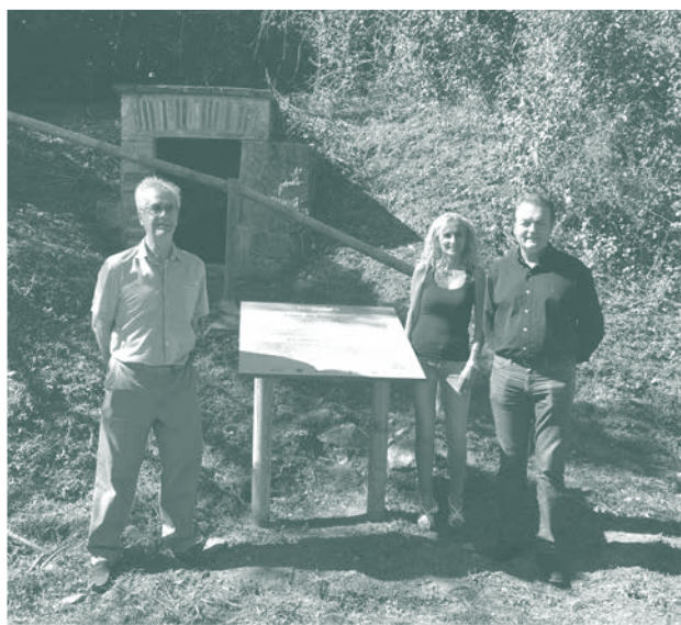
Senyalització de la font de Can Janic.

A finals d'any hi haurà set indrets més recuperats que esperem que puguin ser identificats d'aquesta mateixa manera.