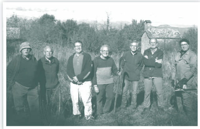
Grup de treball davant l'ermita de Sant Nicolau

Ara fa un any, el novembre de 2015, vam anar a netejar l'entorn de l'ermita de Sant Nicolau, a la pujada de Rocacorba, dins del terme municipal de Sant Miquel de Campmajor. Aquest cop, el dimarts 8 de novembre, vam anar a netejar l'entorn del castanyer, l'arbre monumental catalogat per la Generalitat, situat en el mateix camí de pujada a peu des de Banyoles. Un arbre que, segons la fitxa de la Generalitat, fa divuit metres d'alçada i setze de capçada mitja, i vint, segons el llibre d'arbres monumentals de Costa, Pontacq i Porxas.