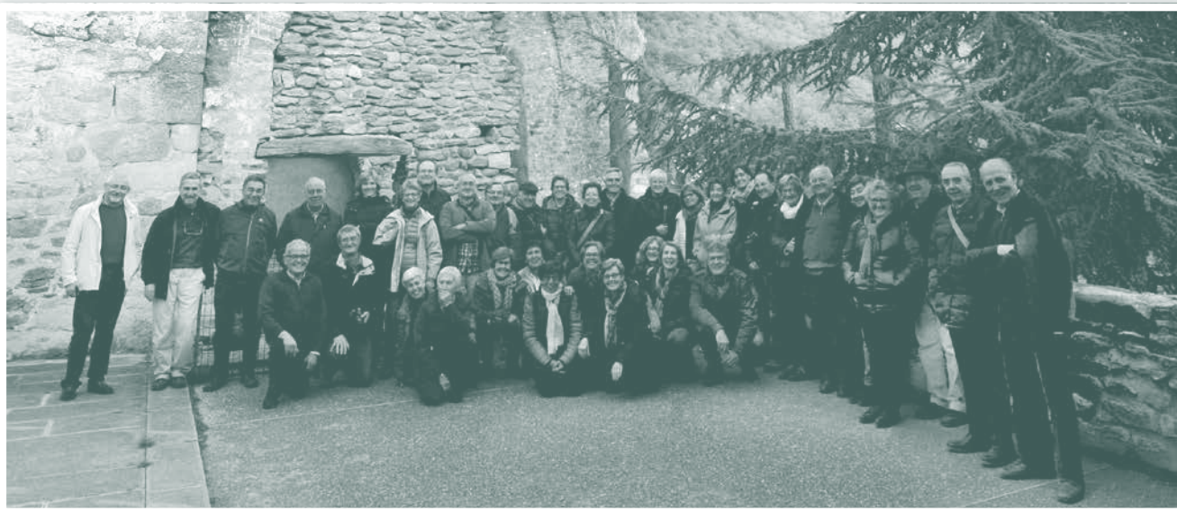
Visita al monestir de Sant Miquel de Cuixà.