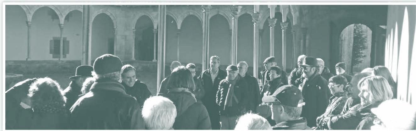
Visita al claustre del monestir de Sant Joan de les Abadesses.

Va ser una sortida matinal molt completa i intensa; un matí de desembre lluminós, fresquet, però gratificant, que ens va permetre gaudir de tot un símbol d'aquests centres monàstics tan transcendents del nostre patrimoni cultural.