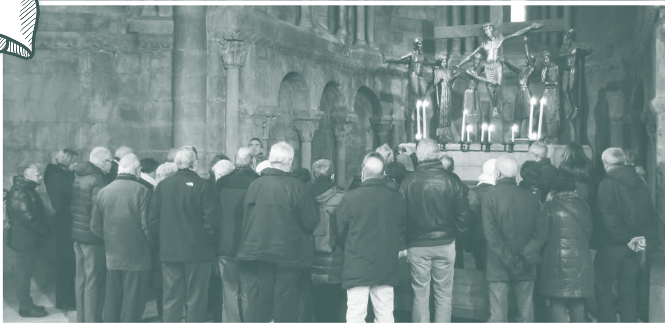
Visita al monestir de Sant Joan de les Abadesses.