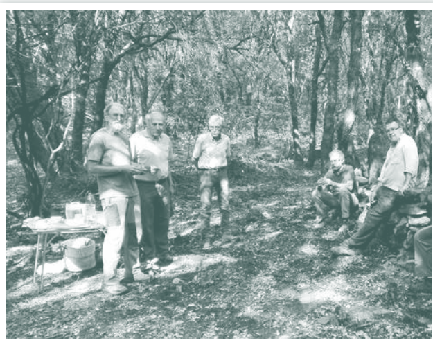
Grup de treball, fent un descans, al camp Tancat de Camós.

No vam aconseguir posar-les totes dretes, però en vam poder aixecar un parell de grosses, que ens van costar més d'una hora cadascuna (estaven travades entre arrels i pedres). Finalment ho vam aconseguir amb l'ajut de ternals. Ara ja només en quedaran un parell de no tan grans. També vam aixecar un bon tram de paret seca, que estava mig caiguda.